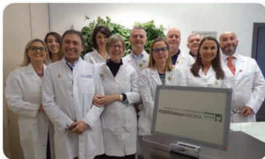
Il Consiglio Direttivo di Federfarma Verona

PILLOLE è il Free Press trimestrale di Federfarma Verona a carattere scientifico-divulgativo e di facile lettura che viene distribuito nelle 257 farmacie aderenti a Federfarma Verona.