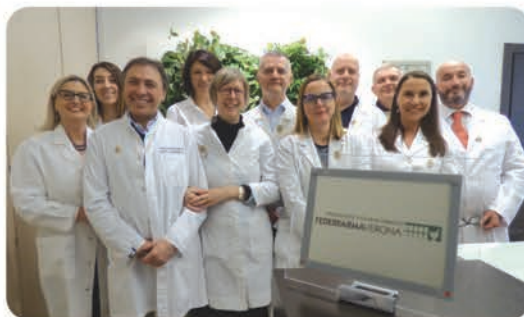
Il Consiglio Direttivo di Federfarma Verona

PILLOLE è il Free Press trimestrale di Federfarma Verona a carattere scientifico-divulgativo e di facile lettura che viene distribuito nelle 251 farmacie aderenti a Federfarma Verona.