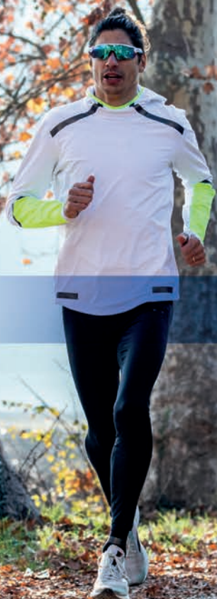
ALESSANDRO FABIAN (12 volte Campione Italiano)